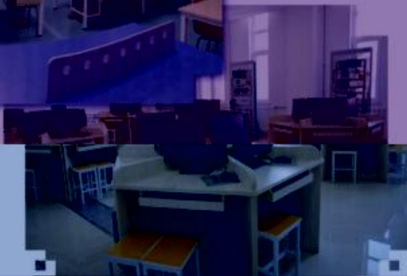
一体化课程教学设计 综合实训室