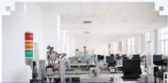
自动化生产线安装与 调试训练场所