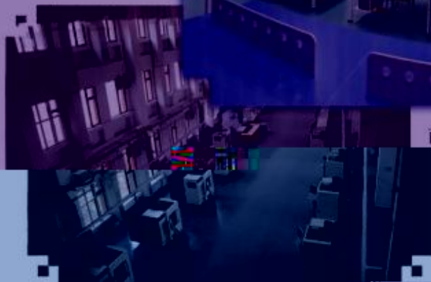
DMG 数控技术 训练场所